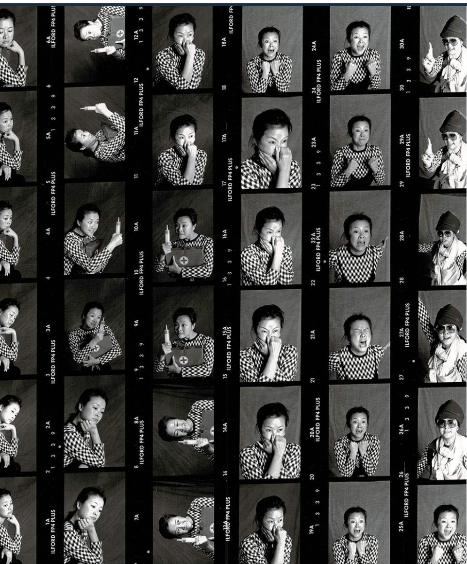
TPEL, Les secrets de Chloé, 1991, Planche-contact