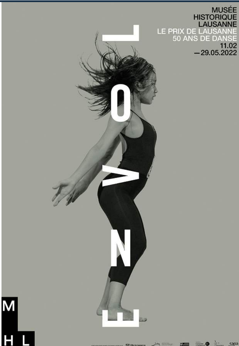
Affiche de l'exposition «Envol. Le Prix de Lausanne, 50 ans de danse» © MHL / Prix de Lausanne