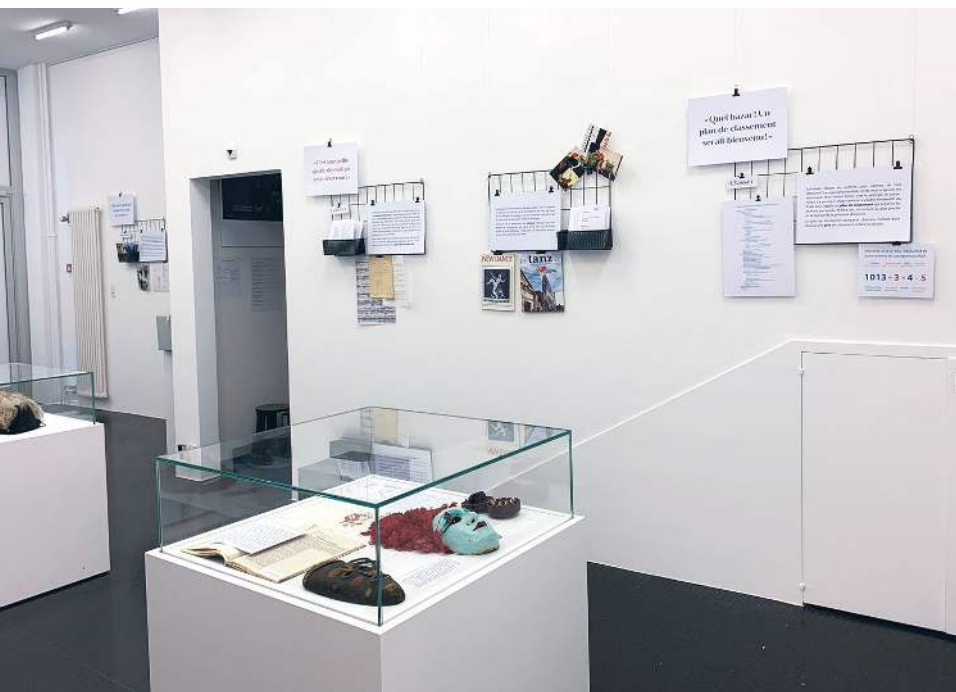
Aperçu de l'exposition sur le métier d'archiviste au bureau de Lausanne

La nouvelle exposition à Lausanne, qui a été inaugurée pendant la Nuit des musées 2022, présente le cœur de métier de SAPA : le travail des archivistes des arts de la scène. La conception de l'exposition a suivi une méthode volontairement transversale, impliquant toute l'équipe, y compris les personnes qui ne s'occupent pas des archives. Ce regard décalé permet de présenter de manière ludique, voire humoristique, les tâches quotidiennes finalement très peu connues de l'archiviste. Une chasse au trésor adaptée aussi bien aux enfants qu'aux adultes complète l'offre de l'exposition. La scénographie minimaliste a été conçue dans un souci de durabilité, tout pouvant être réutilisé ou recyclé.