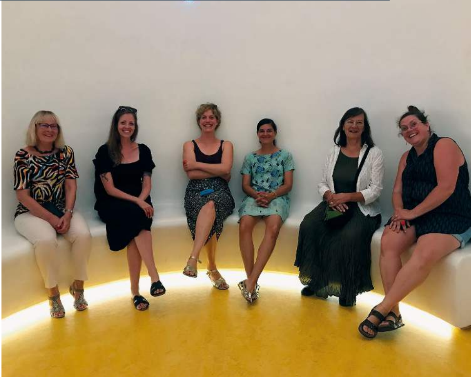
Femmes SAPA dans l'œuf pendant la visite de la station ornithologique de Sempach