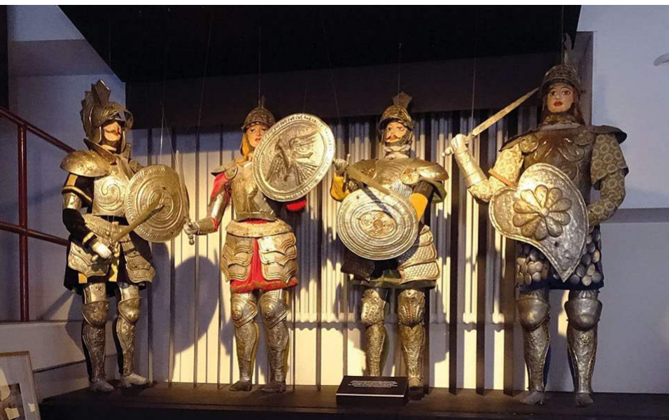
Marionnettes à tringles siciliennes

Lors de la Nuit des musées de Berne, la fondation SAPA a présenté une exposition spéciale sur le thème «Les mondes du théâtre sicilien», élaborée en collaboration avec la faculté d'architecture de l'université de Stuttgart. Des maquettes de construction de théâtre et des documentations photographiques sur le riche passé théâtral de la Sicile, réalisées dans le cadre d'un projet de recherche dirigé par le Dr. Susanne Grötz, ont été présentées. L'exposition temporaire était complétée par des objets propres à SAPA, notamment des marionnettes siciliennes à tringles plus grandes que nature. L'exposition présentée en exclusivité en Suisse ainsi que les visites guidées thématiques par PD Dr. Heidi Greco-Kaufmann ont suscité un vif intérêt. L'exposition historique permanente, remise en état et datant de la période précédant SAPA, a également été très visitée.