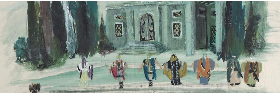
André Perrotet de Laban, La Fiancée de Messine (Friedrich Schiller), Théâtre romain August 1950/51 Crayon, aquarelle et gouache sur papier transparent, 47,5 x 68 cm

Le projet peut être réalisé grâce aux contributions de la Burgergemeinde de Berne, de la Fondation Ernst Göhner, de la Fondation culturelle de l'AIB Assurance immobilière Berne, de la Fondation Pro Scientia et Arte, de la Fondation Ruth & Arthur Scherbarth et de la Fondation Claire Sturzenegger-Jeanfavre.