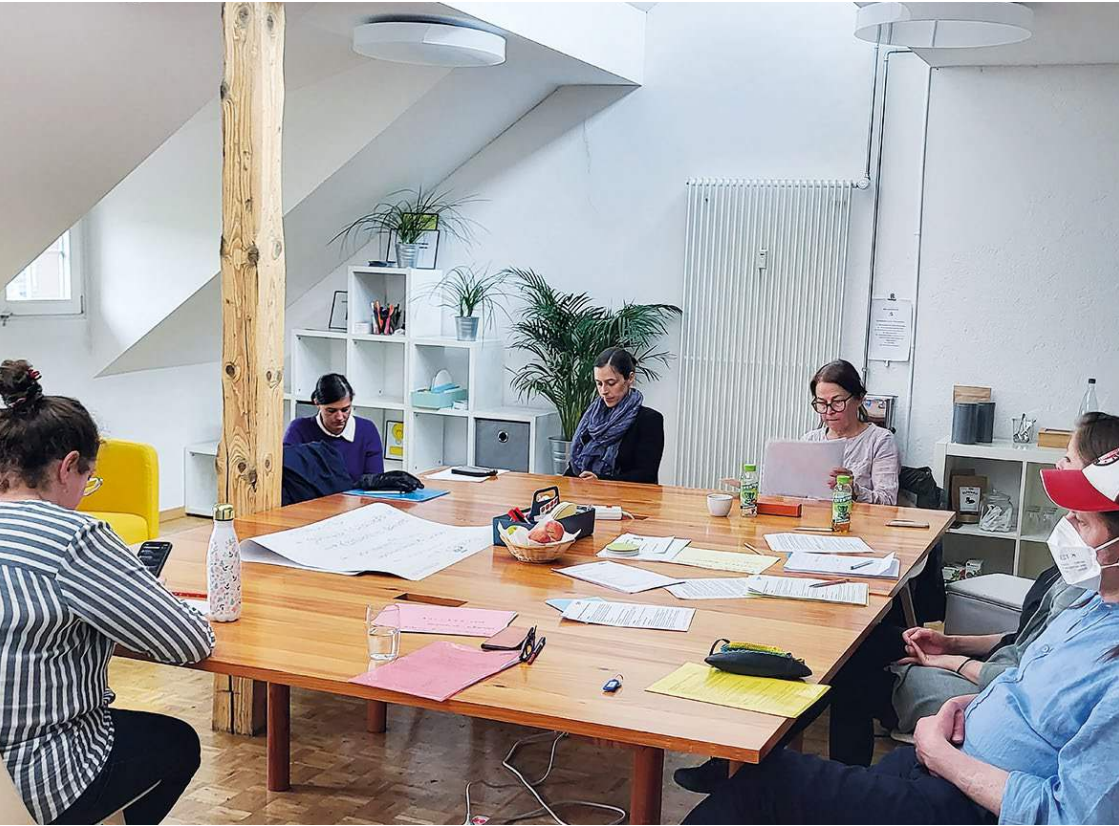
Réunion consacrée à la stratégie avec les collaborateurs:trices de la Fondation SAPA, mai 2022